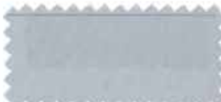
383 Light gray