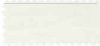
368 Light beige