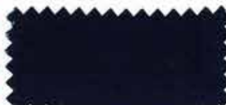
326 Dark blue