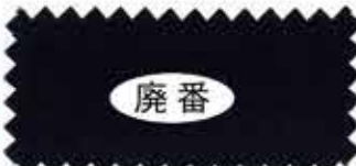
377 Midnight blue