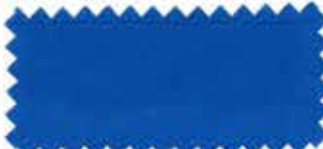
323 Grayish blue