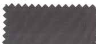
325 Dark gray