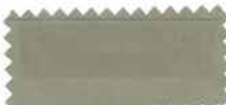
380 Light camel