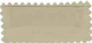
303 Cream brown