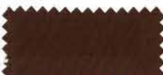
367 Medium brown