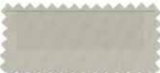
379 White camel