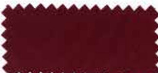
391 Dark crimson