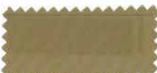
381 Mocha brown