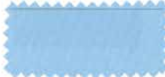
318 Saxe blue