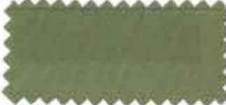
365 Light olive