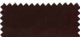
306 Dark brown