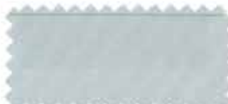
307 Silver gray