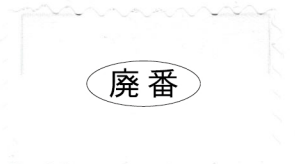
B-19 Off-white オフホワイト