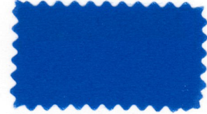
723 Grayish blue ナンド