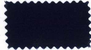
726 Dark blue 紺