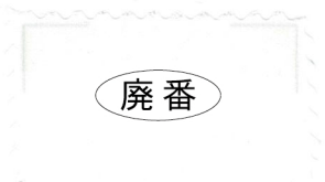
727 White 白