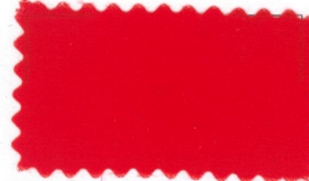
715 Red 赤