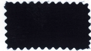
772 Midnight blue コイ紺