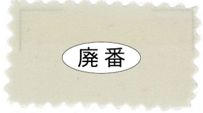
703 Cream brown クリーム茶