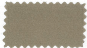
704 Dark cream brown ラクダ