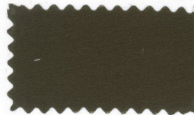
755 Mocha brown モカ茶