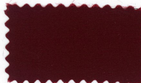
716 Dark red エンジ