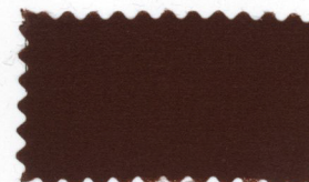
706 Dark brown コゲ茶