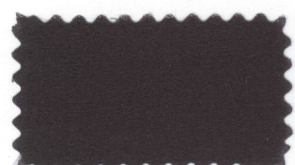
725 Dark gray コイネズミ