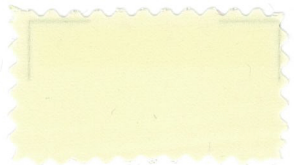
701 Cream クリーム