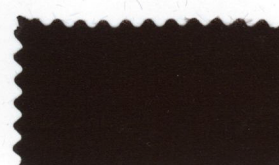
773 Dark chocolate コイ茶