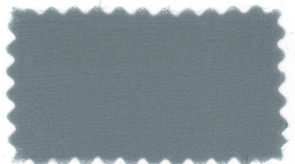
708 Gray ネズミ