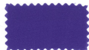
724 Royal blue ハナコン