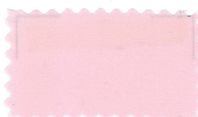
709 Pink ピンク