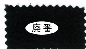
728 Black 黒

※ 在庫限りで販売終了となります ※ Will be discontinued due to limited stock.