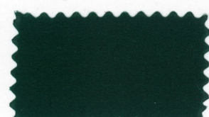
721 Green グリーン