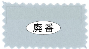
707 Silver gray ギンネズミ