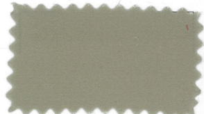
754 Camel キャメル