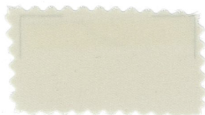
732 Beige ベージュ