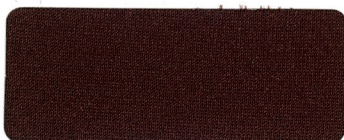
* 405 MARRON