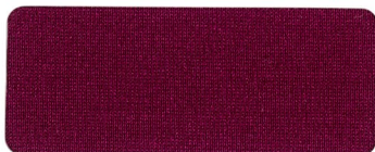
* 416 GARNET