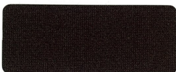
499 DARK SEPIA