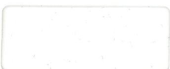
* 471 BEIGE