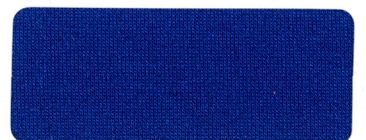
424 VIVID BLUE