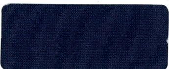
472 BLACK TULIP