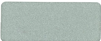
408 SILVER SHINE