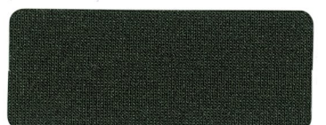
* 470 KHAKI