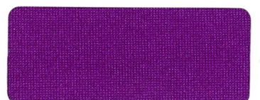
413 ROYAL PURPLE