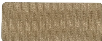
403 LIGHT OAK