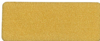
* 436 GINGER