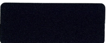
497 BLACK INK