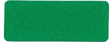
448 CHRISTMAS GREEN