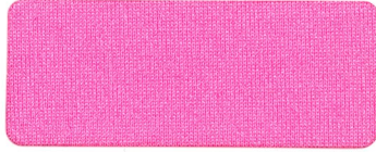
409 ROSE PEARL