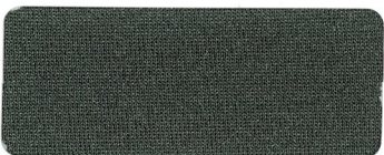
* 425 CHARCOAL GRAY