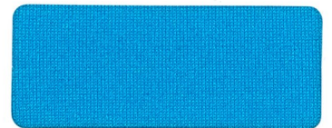
422 BLUE SHELL