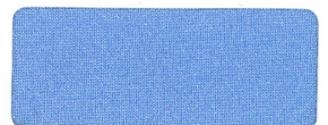
418 CHALK BLUE