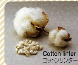
Cotton linter コットンリンター