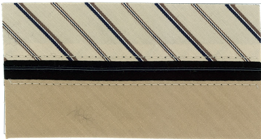
2 mm Dome 2mm ドーム