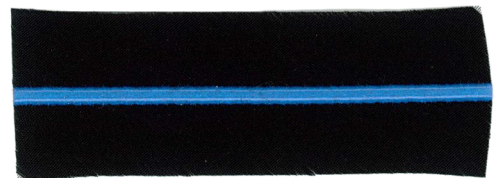
2 mm Dome with color <Col : BLUE> 2mmドーム 色付 <カラー：ブルー>