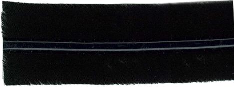
4 mm Dome 4mm ドーム