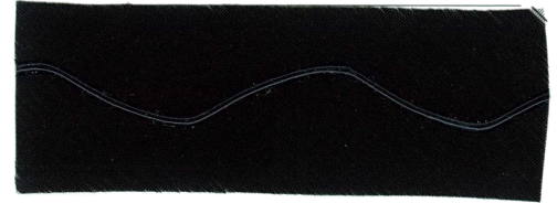
Wave form ウェーブフォーム