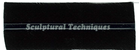
4 mm Dome with LOGO 4mmドーム ロゴ入

*Base material is #800 Decine bias tape. (Size : 22mm / Col : 828)