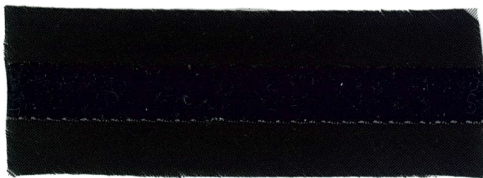
8 mm Flat 8mm ベタ