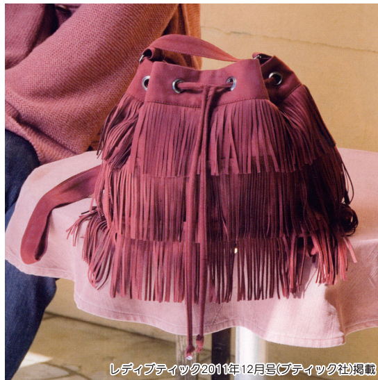
レディースティック2011年12月号(ブティック社)掲載