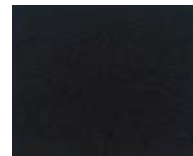
107 Dark brown