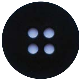
Thickness : 2.0mm 厚み : 2.0mm