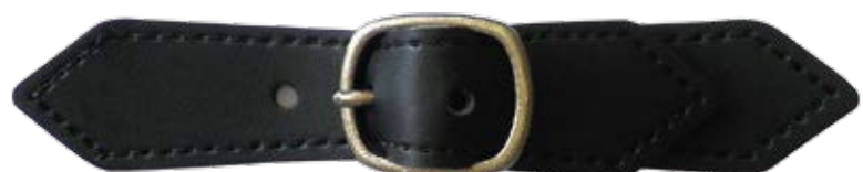
Stitched (Thickness : 2.0mm) ステッチあり (厚み : 2.0mm)