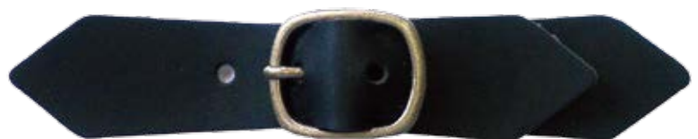
Plane (Thickness : 1.5mm) ステッチなし (厚み : 1.5mm)