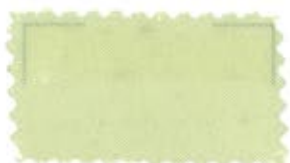
※701 Cream クリーム