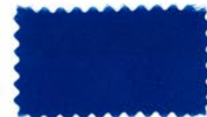
723 Grayish blue ナンド