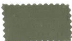
754 Camel キャメル