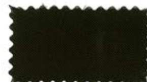
755 Mocha brown モカ茶