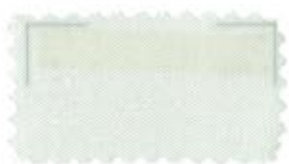
B-19 Off-white オフホワイト