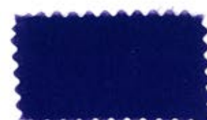
724 Royal blue ハナコン