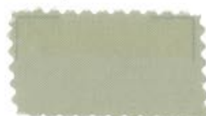
703 Cream brown クリーム茶