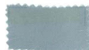
707 Silver gray ギンネズミ