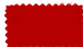
715 Red 赤