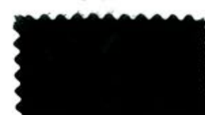
728 Black 黒