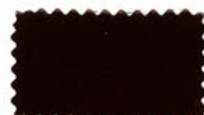
706 Dark brown コゲ茶