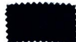
726 Dark blue 紺