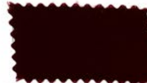
716 Dark red エンジ