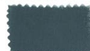
708 Gray ネズミ