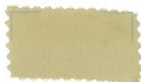
732 Beige ベージュ