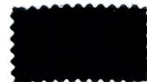
772 Midnight blue コイ紺