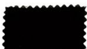
773 Dark chocolate コイ茶