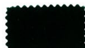
721 Green グリーン