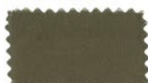
704 Dark cream brown ラクダ