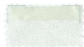
727 White 白