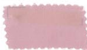
709 Pink ピンク