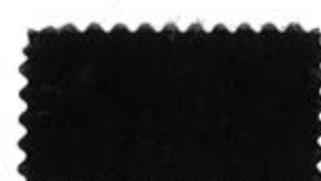
725 Dark gray コイネズミ