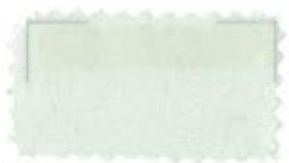
751 Ivory アイボリー