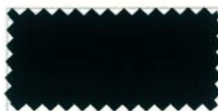
728 Black 黒