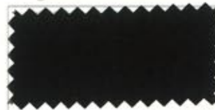
706 Dark brown コゲ茶