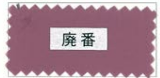
711 Rose ローズ