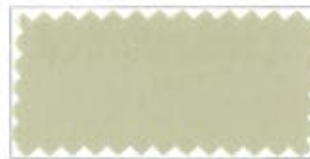
703 Cream brown クリーム茶