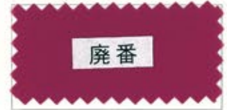
743 Cherry rose コウバイ