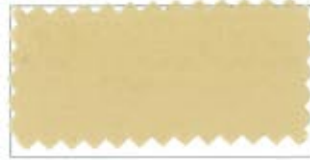
732 Beige ベージュ