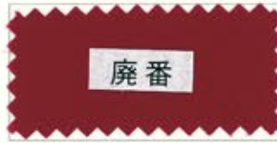
731 Crimson 赤エンジ