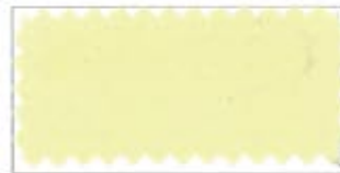
701 Cream クリーム