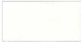
751 Ivory アイボリー