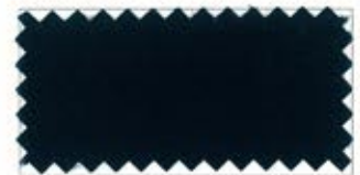
726 Dark blue 紺