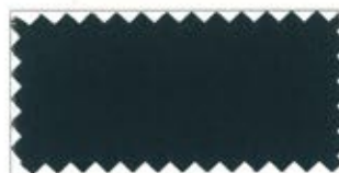
725 Dark gray コイネズミ