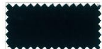
772 Midnight blue コイ紺