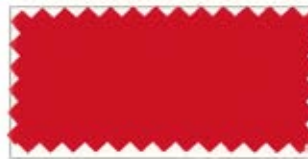
715 Red 赤