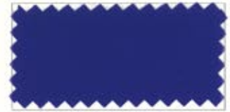
724 Royal blue ハナコン