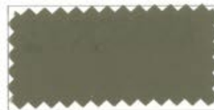
704 Dark cream brown ラクダ