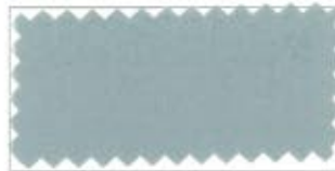
707 Silver gray ギンネズミ