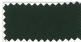
755 Mocha brown モカ茶