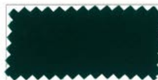
721 Green グリーン