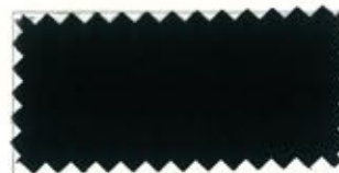
773 Dark chocolate コイ茶