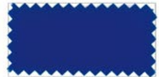
723 Grayish blue ナンド