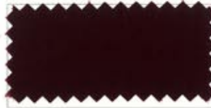
716 Dark red エンジ