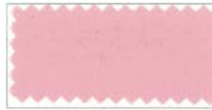
709 Pink ピンク