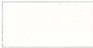
727 White 白