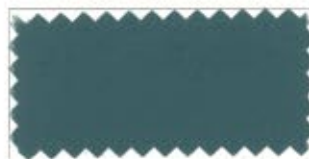
708 Gray ネズミ