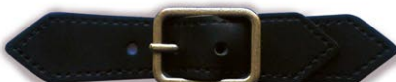
Stitched (Thickness : 2.0mm) ステッチあり (厚み : 2.0mm)