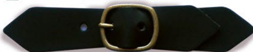
Plane (Thickness : 1.5mm) ステッチなし (厚み : 1.5mm)