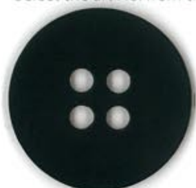
Thickness : 2.0mm 厚み : 2.0mm