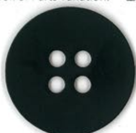
Thickness : 1.5mm 厚み : 1.5mm