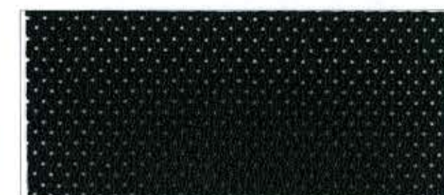
Soware / 0014