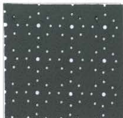
Lot.No.P10-7 Drape / 1953 ※生地巾120cmまで加工可能です