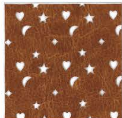
Lot.No.PS-2G Meliton / 5517