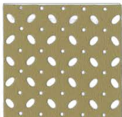
Lot.No.P-8 Mayfair / 5041