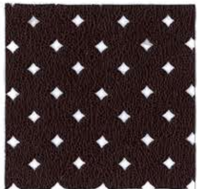
Lot.No.PB5-20 Mayfair / 5013