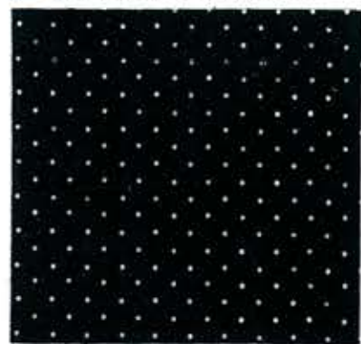
Lot.No.P-111 Drape / 1303