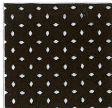
Lot.No.PJ-1 Lamous / 405