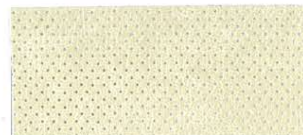
Soware / 0031