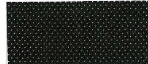
Soware / 0024