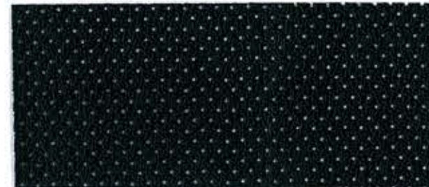
Soware / 0019