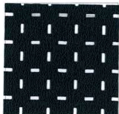
Lot.No.PA2-6 Soware / 0006 ※生地巾120cmまで加工可能です