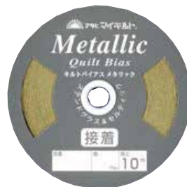
キルトバイアス 10m巻 キルトバイアス 5m巻 メタリックキルトバイアス 10m巻