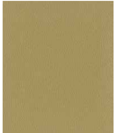
Ⓓ [#5000 Mayfair] + 1.5mm Felt [#5000 メイフェア] + 1.5mm厚スライサー