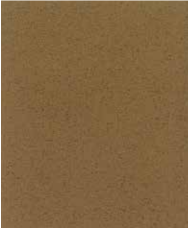
Ⓐ [#1231A Lamous] Thickness : Ab1.5mm [#1231A ラムース] 厚み：約1.5mm