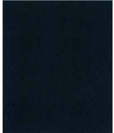
Ⓑ [#70S11 Drape] Thickness : Ab1mm [#70S11 ドレープ] 厚み：約1mm