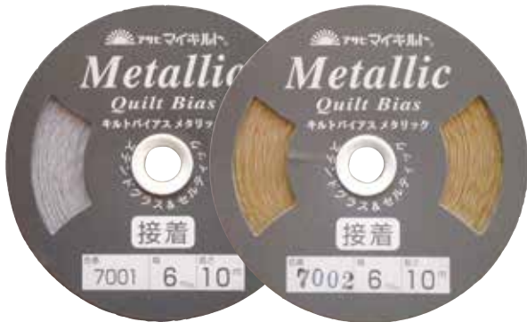
サイズ:4mm幅・6mm幅/長さ:10m巻

アイロンやコテで簡単に仮接着できる画期的なバイアステープのメタリックバージョンです。