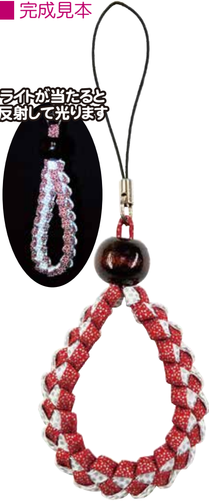
《WF-52 (A)》 赤×白