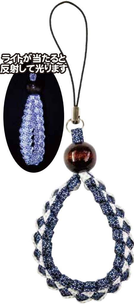
《WF-53 (B)》 紺×白