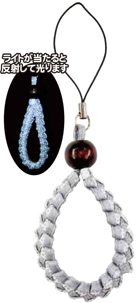
《WF-54 (C)》 グレー×白